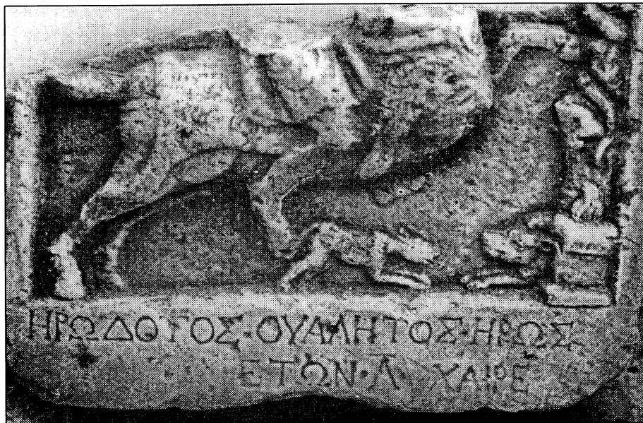
Εικ. 2. Επιτύμβια στήλη με παράσταση ιππεία.

Από τις επιτύμβιες στήλες εξαιρετικές θεωρούνται δύο που εικονίζουν ιππείς. Στη μία η επιφάνεια είναι αρκετά φθαρμένη από τη μακρόχρονη παραμονή της μέσα στο νερό. Βρέθηκε στα νότια του νησιού σε μια αρχαϊκή νεκρόπολη. Στην άλλη η σκηνή είναι συμβολική (εικ. 2). Ένας ιππέας ντυμένος με χιτώνα εικονίζεται πάνω σε άλογο που καλπάζει προς τα δεξιά. Το άλογο αναστηλώνεται στα δύο πόδια μπροστά από ένα δέντρο, γύρω από το οποίο τυλίγεται ένα φίδι. Στο κάτω μέρος απεικονίζεται ένας βωμός και ένα αγριογούρουνο αντικριστά μ' ένα σκυλί. Κάτω από την παράσταση υπάρχει η επιγραφή: «ΗΡΩΔΟΤΟΣ. ΟΥΑΛΗΤΟΣ. ΗΡΩΣ. ΕΤΩΝ. Λ. ΧΑΙΡΕ».