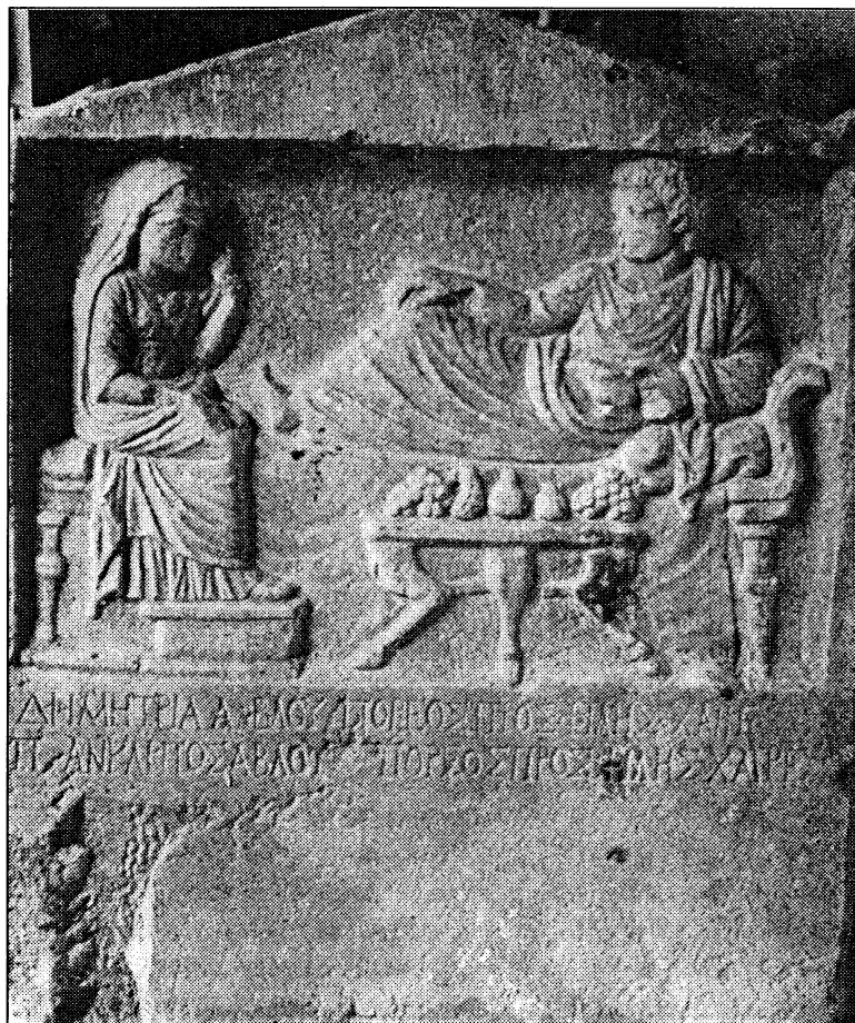
Εικ. 3. Ανάγλυφο νεκρικού συμποσίου.

φικότερη σημειολογία. Στο κάτω μέρος υπάρχει η επιγραφή: «ΒΕΝΔΟΥΣ ΔΙΕΟΥΣ». Το ανδρικό όνομα Δίης είναι σπάνιο στη Θάσο, σε αντίθεση με το γυναικείο όνομα Βένδους, που συναντιέται συχνά στο νησί.