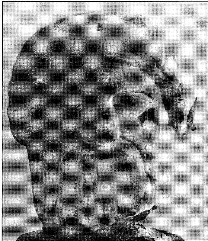
Εικ. 1. Κεφάλι αφιερωμένο στο Θεογένη.

τόμο 97 του γαλλικού περιοδικού Bulletin Correspondence Hellenique , όπου υπάρχει το άρθρο των Y. Grandjean, B. Holtzmann και C. Rolley με τίτλο: “Antiquites thassiennes de la collection Papageorgiou”.