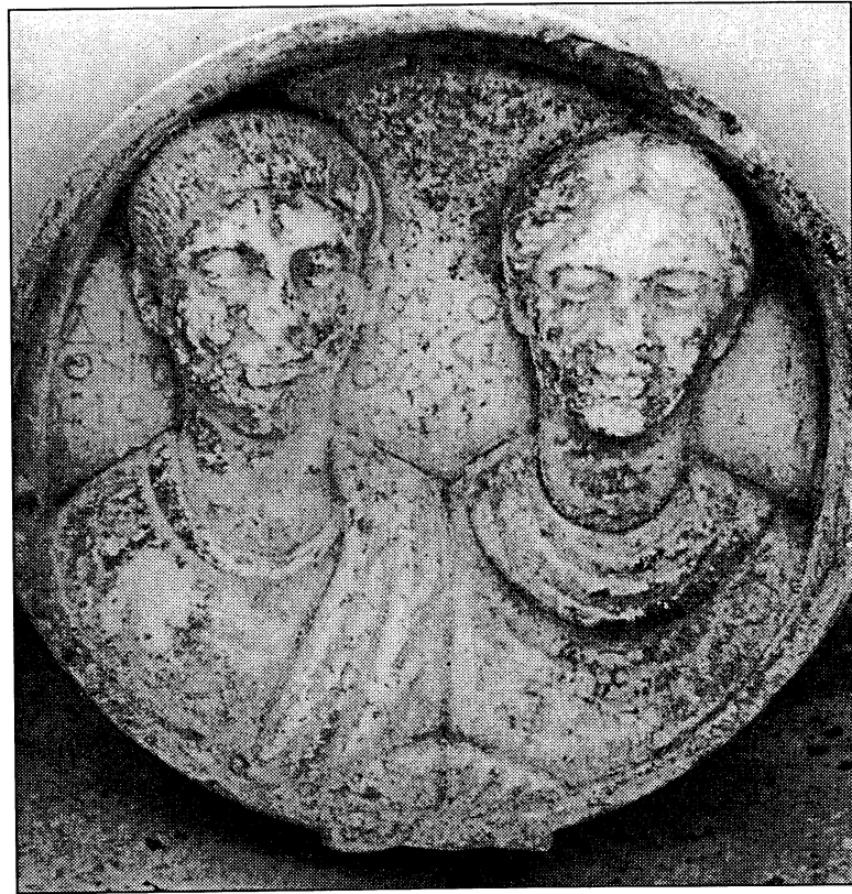
Εικ. 4. «Κόσμημα του Διόνυσου».

πλο στο κεφάλι. Οι δύο κορμοί είναι ελαφρώς γυρισμένοι ο ένας προς τον άλλο. Δεν αποδίδουν ωστόσο τα ιδιαίτερα χαρακτηριστικά τους ως προς το σχήμα του προσώπου και τα μαλλιά, ενώ η γυναίκα δε φοράει κοσμήματα. Έτσι, το μόνο που γνωρίζουμε είναι ότι εικονίζονται ακόμα νέοι, αν και αυτή η νεότητα θα μπορούσε να είναι στοιχείο εξιδανίκευσης. Στο άλλο κόσμημα ένα παιδί, που βρίσκεται ανάμεσα στους γονείς του, κρατάει μικρό κατοικίδιο, όπως σε όλες τις νεκρικές εικονογραφίες της αρχαιότητας. Τα ρούχα είναι κοινότυπα. Χιτώνας και μανδύας στον ώμο του άνδρα, χιτώνας με ζώνη και πέπλο για τη γυναίκα. Δυστυχώς αγνοούμε τη χρονολογία.