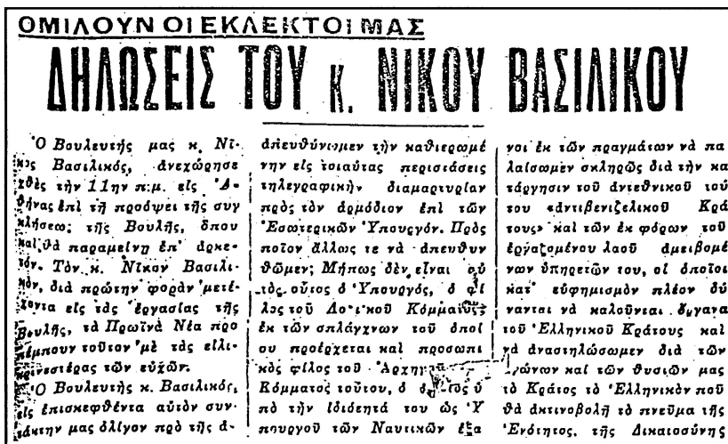
Δηλώσεις του βουλευτή Νίκου Βασιλικού στα «Πρωινὰ Νέα», φ. 25-2-1936.

τέφερε στο πολεμικό ημερολόγιό του όλο το υλικό που είχε κρατήσει μέχρι τον Οκτώβριο του 1921. Το υπόλοιπο το επεξεργάστηκε αργότερα, όταν το 1935 βρισκόταν στις φυλακές της Καβάλας.