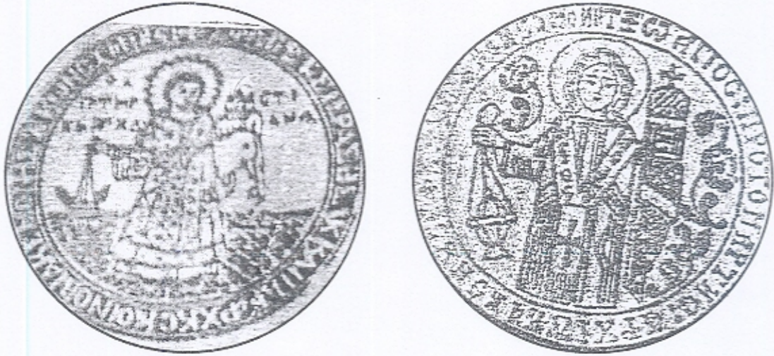
Παλιές σφραγίδες της Μονής Κωνστανονίου.