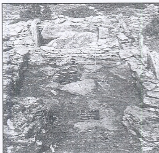
Εικ. 3. Ληνός I. Υπολήνιο.