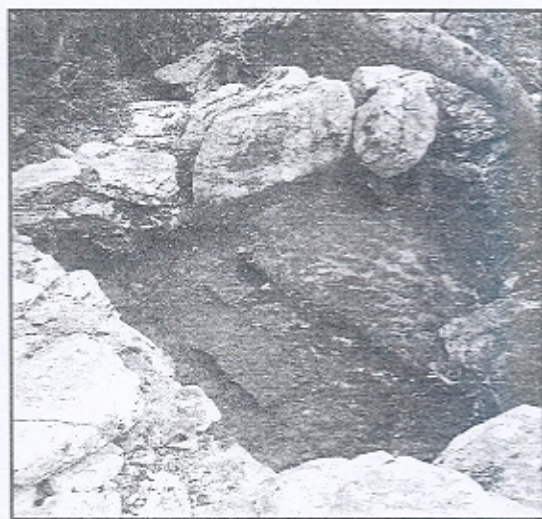
Εικ. 4. Ληνός II.