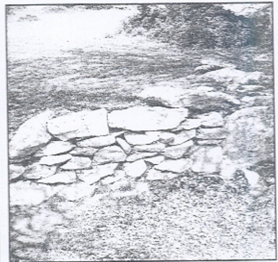
Εικ. 2. Ληνός Ι.