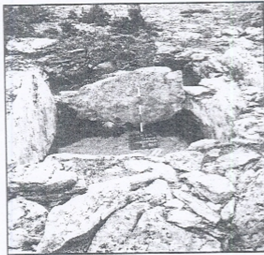
Εικ. 1. Ανάλημμα αμπελώνων.