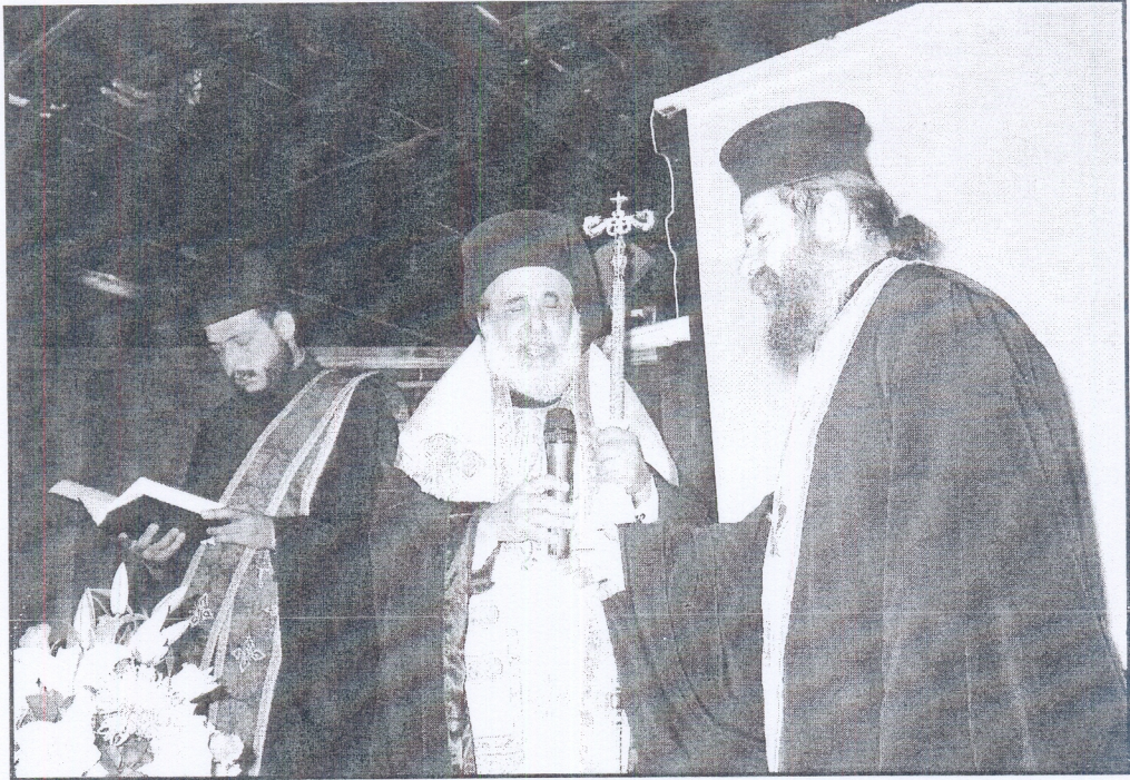
Ο μητροπολίτης Φιλίππων-Νεαπόλεως και Θάσου την ώρα του αγιασμού.