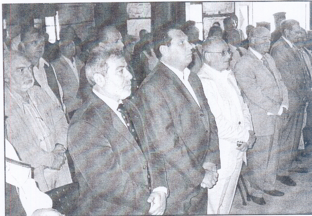
Αναμνηστική φωτογραφία. Διακρίνονται κατά σειρά: 1) Ο βουλευτής Καβάλας Μ. Τιμοσίδης, 2) ο πρώην βουλευτής Σάββας Εμινίδης, 3) ο πρόεδρος της διευρυμένης νομαρχιακής αυτοδιοίκησης Δράμας-Καβάλας-Ξάνθης Κων/νος Τάτσης, 4) ο πρώην υπουργός Δημ. Δημοσθενόπουλος και 5) ο πρόεδρος του Α.Π.Θ. Αναστ. Μάνθος.

νη και Σουζάνα Βουγιουκλή. Δυστυχώς, ο παγερός αέρας της βραδιάς εκείνης αδίκησε τις δύο θαυμάσιες φωνές των κοριτσιών, γιατί οι περισσότεροι Σύεδροι παρέμειναν μέσα στο ξενοδοχείο, για ν' αποφύγουν το τσουχτερό κρύο, που δε σ' άφηνε, πράγματι, να απολαύσεις τις θεσπέσιες εκείνες φωνές των δύο αδελφών.