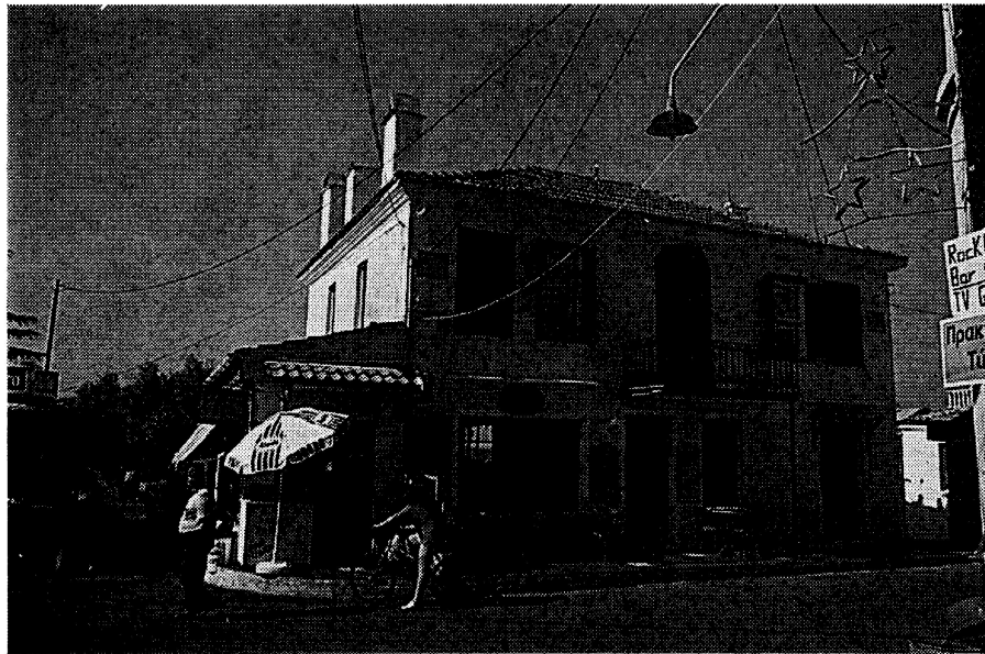
Φωτ. 2. Το σπίτι του Γεωργίου Κρητικού στα Λιμενάρια (1898).

Μελετώντας προσεκτικά το συμβόλαιο είναι φανερή η διαπίστωση ότι οι κάτοικοι έχουν εντυπωσιαστεί από τη νέα μορφολογία που χαρακτηρίζει το νεόκτιστο σπίτι του Γεωργίου Κρητικού (φωτ. 2). Το σπίτι αυτό είναι διώροφο με υπόγειο. Το ισόγειο είναι διαμορφωμένο σε κατάστημα, ενώ ο όροφος σε κατοικία. Η βόρεια και η νότια όψη του πλουτίζονται με κεντρικά μικρά μπαλκόνια. Η βορινή όψη προς τον παλιό δρόμο φέρει απομίμηση γωνιολίθων στα άκρα, ενώ υπάρχουν και άλλα νεοκλασσικά κοσμήματα. Χαρακτηριστική είναι η μπαλκονόπορτα με το ημικυκλικό υπέρθυρο και σπάνια η μορφή των παραθύρων της πρόσοψης με τα πολλά μικρά καΐτια.