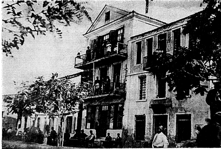
Φωτ. 3. Το κοινοτικό κατάστημα σε φωτογραφία του 1915. Το κτίριο βρίσκεται στα δεξιά της φωτογραφίας.

εκτός του ισογείου που είναι καινούργια, είναι στενά και ψηλά. Φέρουν φεγγίτες και είναι δίφυλλα ανοιγόμενα. Η γριπίδα είναι σοβατισμένη και έτσι δε φαίνεται ο τρόπος κατασκευής της. Ταινία ορίζει τη στάθμη του πάνω ορόφου που φέρει στα άκρα του απομίμηση ψευδοπαραστάδων. Τα στοιχεία αυτά είναι σοβατισμένα με τριφτό σοβά, σε αντίθεση με το σώμα του κτιρίου που φέρει άγριο σοβά, όπως συμβαίνει με το σπίτι Κρητικού. Αξιοσημείωτη είναι η συμμετρικότητα της πρόσοψης, η οποία δεν παρατηρείται στο παλιότερο σπίτι. Η επικάλυψη της στέγης γίνεται με ευρωπαϊκά κεραμίδια. Δύο καμινάδες υψώνονται στο δυτικό τμήμα της.