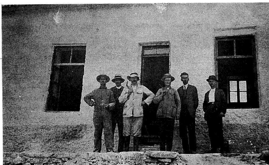
Εργάτες των μεταλλείων Βούβες. Ιούνιος 1926.

ρήλθαν στη βελγική εταιρεία G. P. Boseret, από το Lutich, που αγόρασε το σύνολο των μετοχών της κρατικής «Ανώνυμης Ελληνικής Εταιρείας Μεταλλείων και Μεταλλευμάτων». Το 1957 η Friedrich Krupp GmbH απέκτησε το σύνολο των μετοχών της παραπάνω ανώνυμης εταιρείας. Το 1963 έληξε το δικαίωμα εκμετάλλευσης των ορυχείων Θάσου και η κυριότητα των ορυχείων και των πάσης φύσεως κτιριακών εγκαταστάσεων επέστρεψε στο ελληνικό δημόσιο.