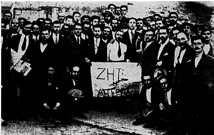
Από την απεργία και το συλλαλητήριο των Θασίων. Καβάλα 1929.

Τα επεισόδια διαδέχονται το ένα το άλλο: την Κυριακή 20-10-1929 συγκεντρώνονται στα Λιμενάρια καπνεργάτες από ολόκληρη τη Θάσο σε συλλαλητήριο διαμαρτυρίας για την μη καταβολή του επιδόματος ανεργίας. Εγκρίνεται ψήφισμα, αλλά μπροστά στην άρνηση των υπαλλήλων του Τηλεγραφείου να το στείλουν στις αρμόδιες αρχές «οι καπνεργάται εξεμάνησαν και ήρχισαν λιθοβολούντες τους νελοπίνακας...». Η επιβολή της τάξης έχει σαν αποτέλεσμα τη σύλληψη των 3 πρωταιτίων των επεισοδίων 61 . Η σύλληψη, το απόγευμα της ίδιας ημέρας, άλλων 5 καπνεργατών οξύνει τα πνεύματα σε τέτοιο βαθμό, ώστε με εντολή του Νομάρχη αναστέλλεται η αποστολή και άλλων αστυνομικών δυνάμεων, ενώ στον «Κήρυκα» της 24-10-29 62 ο γενικός