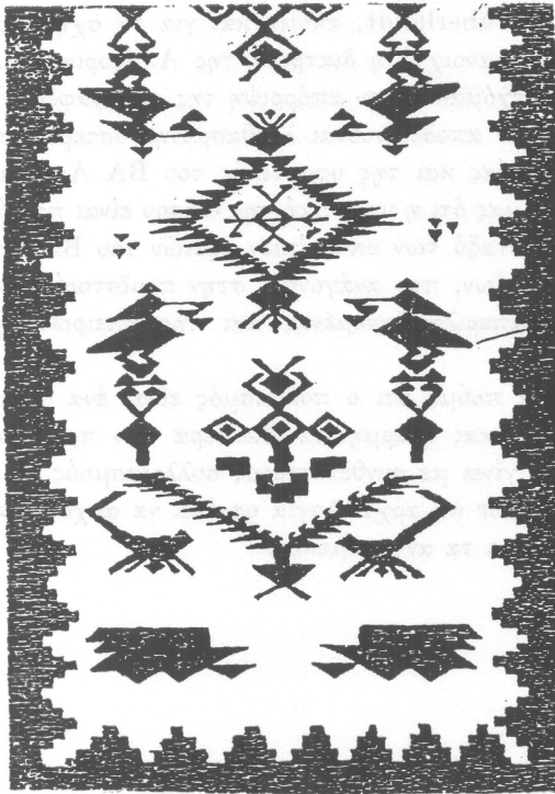
Σχήμα αρ. 2 α Ποδιά Καστοριάς.

Λεπτομέρεια σχηματοποιημένης γυναικείας μορφής από ποδιά Καστοριάς (βλ. σχ. αρ. 2α).