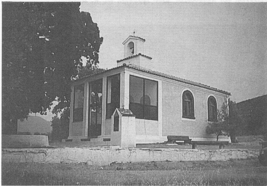
Εξωκκλήσι Αγίου Νικολάου Λιμεναρίων.

2. Αγίου Ελευθερίου . Βρίσκεται βόρεια από τις Καλύβες Λιμεναρίων. Κτίστηκε το 1980, όπως προκύπτει από εντοιχισμένη μαρμάρινη πλάκα που αναφέρει: «Ο ιερός ναός του Αγίου Ελευθερίου ανοικοδομήθηκε από τον αρ-