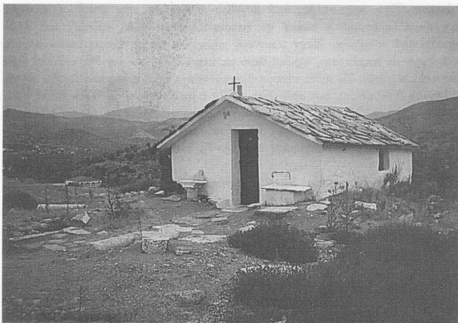
Εξωκλήσι Αγίου Αντωνίου Ποτού.

4. Αγίου Γεωργίου . Βρίσκεται δεξιά του δρόμου ανεβαίνοντας για το