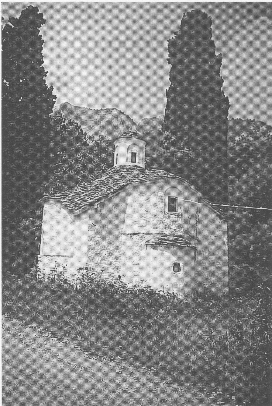
Εξωκκλήσι Αγίου Δημητρίου Ποταμιάς.