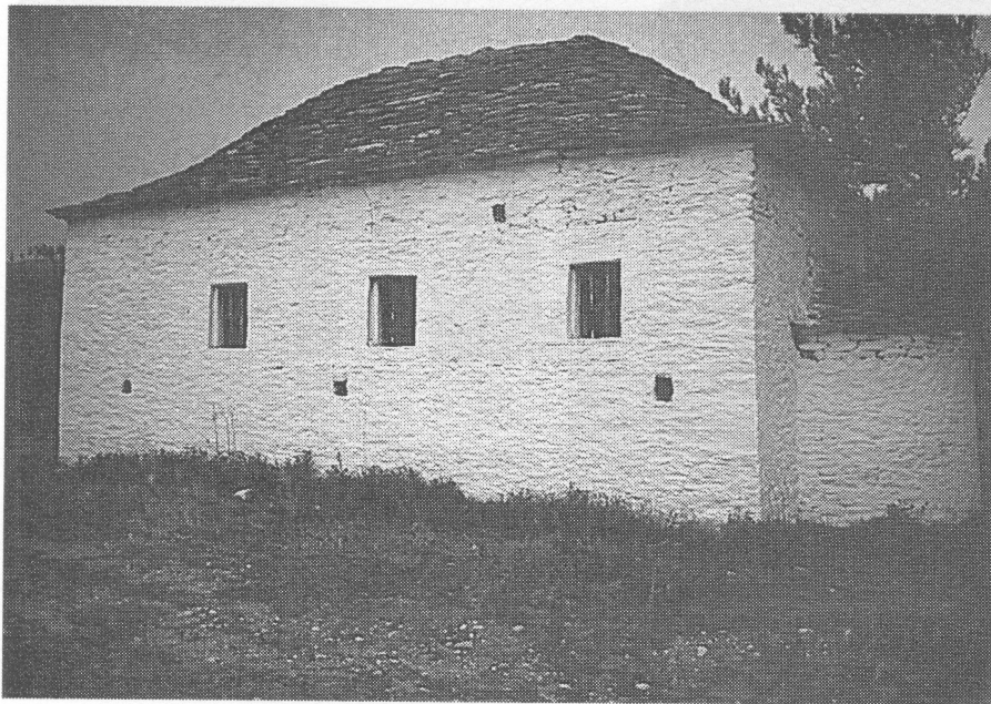
Εξωκκλήσι Αγίου Γεωργίου Θεολόγου.