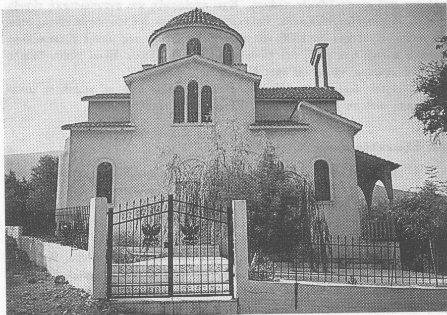
Εξοκκλήσι Αγίας Μαρίνας Καλλιράχης.

7. Αγίας Παρασκευής . Βρίσκεται πάνω σε αγροτικό δρόμο, βόρεια του χωριού. Κτίστηκε το 1990 με δαπάνη του φωτογράφου Πασαλή και όλων των κατοίκων του χωριού.